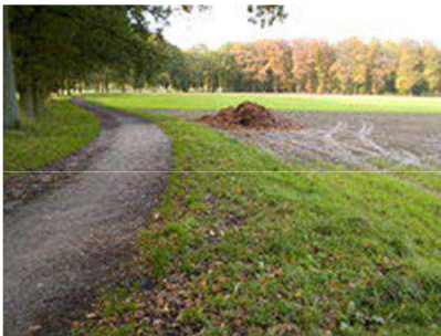
laan op Hoog Erf

Als u bent overgestoken, gaat u linksaf ,achter de bomen, voorlangs Pension Warnsborn, evenwijdig aan de drukke weg. Hierna gaat U schuin rechts een beukenlaan in (bordje "Hoog Erf"). Op 6-sprong van beukenlanen gaat u de brede boslaan met het bankje in. Verderop ziet u in de verte een witte boerderij. Deze laan (zie foto) rechthoekig blijven volgen (zijpaden negeren) tot aan asfaltweg. U bent nu op landgoed Warnsborn .