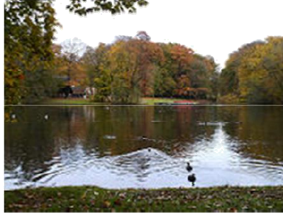
grote vijver Sonsbeek

Als u bent overgestoken, gaat u linksaf ,achter de bomen, voorlangs Pension Warnsborn, evenwijdig aan de drukke weg. Hierna gaat U schuin rechts een beukenlaan in (bordje "Hoog Erf"). Op 6-sprong van beukenlanen gaat u de brede boslaan met het bankje in. Verderop ziet u in de verte een witte boerderij. Deze laan (zie foto) rechthoekig blijven volgen (zijpaden negeren) tot aan asfaltweg. U bent nu op landgoed Warnsborn .