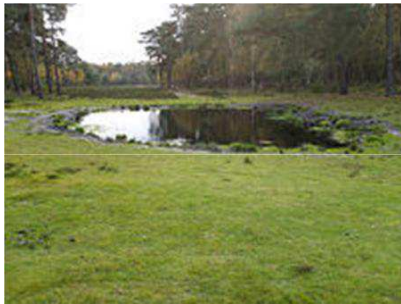
drinkpoel op Johannahoeve

Hier rechts en u steekt de toegangsweg naar Papendal over en verder over het fietspad, langs de drukke N 224, onder het A 50 viaduct door. Ongeveer 200 meter hierna gaat u links af een boslaan in (bord + slagboom Johannahoeve ). Deze eikenlaan (zijpaden negeren) uitlopen tot aan klaphek met bordje "begrazing door runderen". U loopt via dit klaphekje verder rechtdoor, links is de A 50, rechts is een heide. Verderop buigt dit pad naar rechts om later bij een drinkpoel uit te komen (zie foto). Hier gaat u links af, langs en door de heide. Na een klaphek komt u bij een asfaltpad evenwijdig aan de spoordijk. (ook ziet u een tunneltje in die dijk.) U gaat hier rechtsaf en volgt verder dit (nu onverharde) pad, evenwijdig aan de spoorlijn (zijpaden negeren) en verderop komt u in Wolfheze . Rechtdoor blijven lopen en aan uw linkerkant ziet u, aan de overkant van het spoor, het stationsgebouw van Wolfheze . (zie foto). De perrons bereikt u via het tunneltje (geen lift!) naast de overweg. Voor het geval u nog lang op de trein moet wachten : Restaurant "De Tijd" (met terras) ligt naast het station.